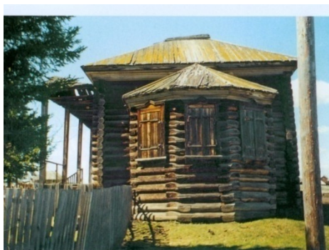
Церковь в д. Яркино