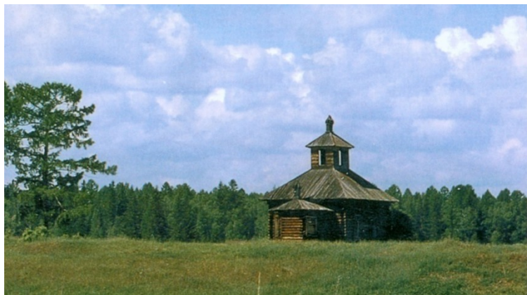
Часовня в д. Юрехта

В 1983 г. по заказу управления культуры Красноярского края предпринята экспедиция ККМ с участием архитектора В.Ф. Бахошко и археологов производственной группы по охране памятников истории и культуры Красноярска. Затем археологическая группа отдела краевого Управления культуры периодически работала в Нижнем Приангарье до 1990-х годов.