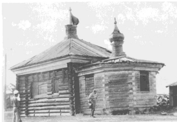
Церковь в д. Мозговая

В 1983 г. по заказу управления культуры Красноярского края предпринята экспедиция ККМ с участием архитектора В.Ф. Бахошко и археологов производственной группы по охране памятников истории и культуры Красноярска. Затем археологическая группа отдела краевого Управления культуры периодически работала в Нижнем Приангарье до 1990-х годов.