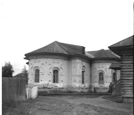
Спасская церковь в с. Кежма

историков, с использованием исторических фондов Красноярского краеведческого музея (ККМ), госархива Красноярского края (ГАКК) и научных фондов библиотек, а также в ходе полевых экспедиций в прибрежные районы рек Ангары и Енисея - с 1985 г.