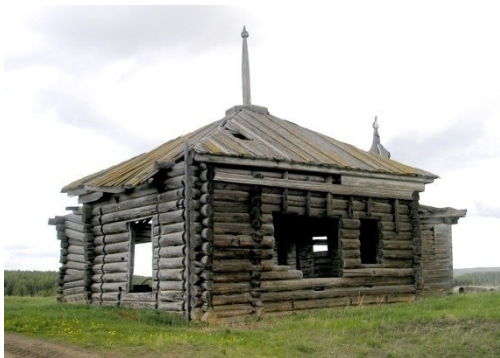
Храм в Верхней Кежме (Мозговая) - 2007 г., перед проектом реставрации

«Находясь на берегах Ангары, испытываешь такое чувство, словно машина времени перенесла нас на много веков назад...», и можно увидеть сохранённые произведения северорусских зодчих в той же природе и в том же климате, и также добросердечны ныне обитатели Бедобы, Иркенево, Каменки и Ярков, живущие по размеренному укладу, бережно сохраняющие традиции – «ведь это их предки строили здешние храмы, резали по дереву, расписывали внутренние перегородки и были так же скромны и трудолюбивы».