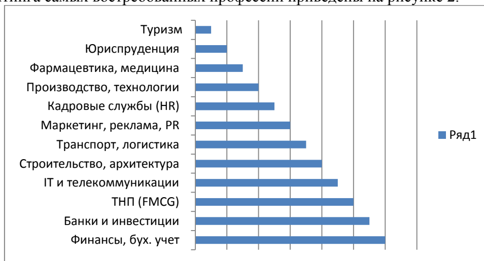
Рис. 2. Рейтинг самых востребованных на рынке труда профессий

По оценкам специалистов кадровых служб, имеющееся сегодня количество вакансий позволяет индивиду, при желании, достаточно быстро устроиться на новую работу. Однако эта тенденция касается, в большинстве случаев, лишь самых востребованных профессий – менеджеров продаж, торговых представителей, мерчендайзеров и других. Появились вакансии для руководящих должностей, но спрос на них по-прежнему гораздо выше предложения. Так, например, на сайте Rosrabota.ru вакансий для руководителей заявлено 114, тогда как резюме, присланных претендентами – свыше 24 тысяч. Редакция журнала «Куда пойти учиться» и образовательный проект «Фортуна» газеты «Московский комсомолец» провели исследование «Рынок труда: самые востребованные вузы и специальности». В исследовании приняли участие 36 ведущих рекрутинговых агентств Москвы, в их числе АНКОР, «Coleman Services», «NextTop», «Агентство Контакт», «А-Класс Рекрутмент». Представителям кадровых агентств было предложено назвать самые популярные профессии в рамках 12-ти наиболее перспективных сфер деятельности. Результаты рейтинга самых востребованных профессий приведены на рисунке 2.