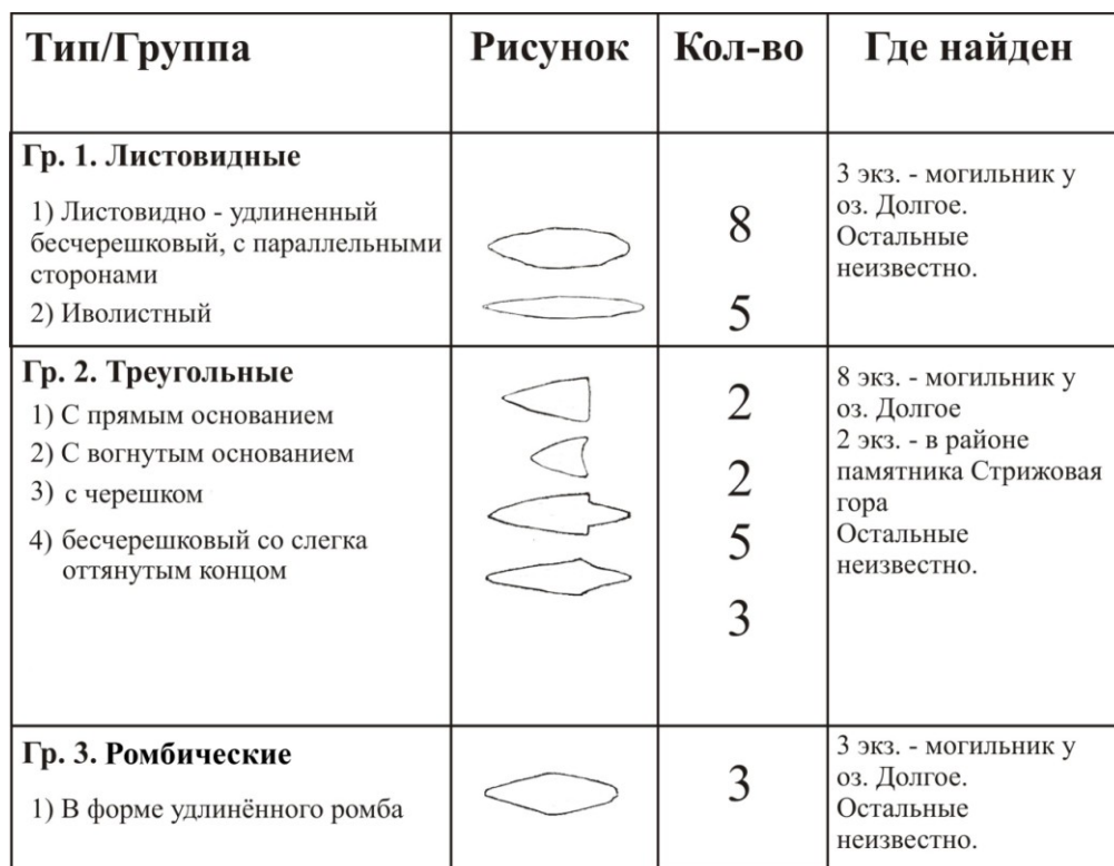
Таблица 1. Типология каменных наконечников стрел, копий дротиков из Канского краеведческого музея

Предметы вооружения из бронзы представлены кинжалами и наконечниками копий.