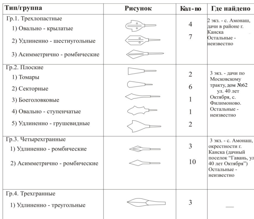
Таблица 2. Типология средневековых наконечников стрел из Канского краеведческого музея

Наконечники стрел (35 экз.) , относятся к одному отделу – черешковых (встречаются плоские и округлые черешки), по сечению пера делятся на плоские, трехлопастные, четырехгранные, трехгранные. По оформлению формы пера преобладают ассиметрично – ромбические, секторные, овально – крылатые и пр. (рис. 2).