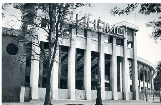
Стадион «Динамо», Москва

Конструктивизм – это одно из самых известных творческих течений советского искусства 20-х годов XX века. Архитектура конструктивизма и по сей день не теряет своей актуальности в силу простоты и функциональности.