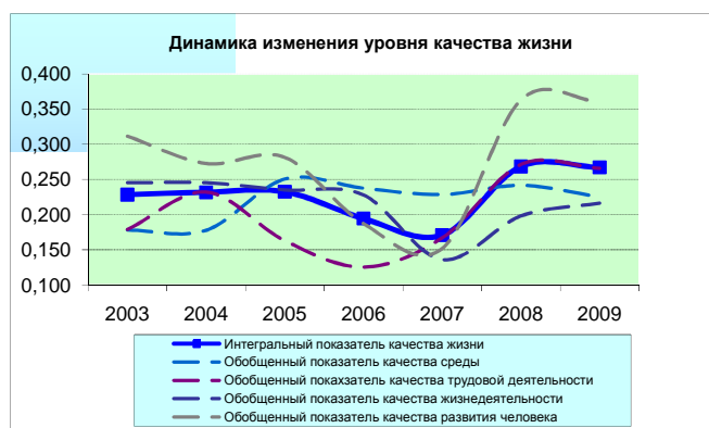
Рисунок 1 – Динамика изменения интегрального показателя качества жизни в зависимости от обобщенных показателей

По обобщенному показателю качества среды Абанский район относится к группе территорий с уровнем ниже среднего, занимая 35-ый ранг. Также район имеет отрицательный темп роста (в период с 2005 по 2009 гг. показатель снизился на 11,5 %).