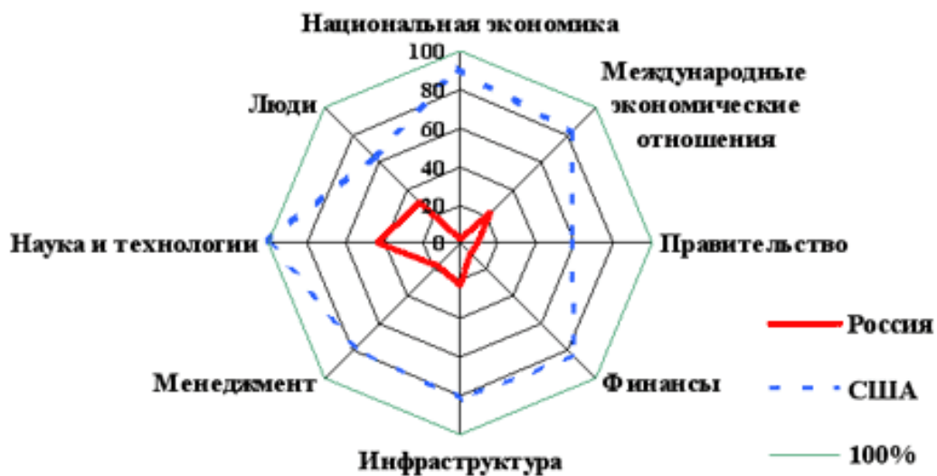
Рисунок 3-Основные компоненты деловой конкурентоспособности России и США

3. Страны – союзники и партнеры по внешнеэкономической деятельности и соответствующие показатели внешнеторгового оборота (объемы импорта и экспорта) и сальдо торгового баланса.