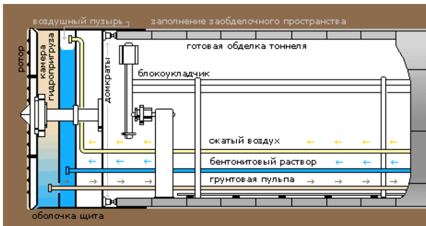
Рис. 3. Механизированный тоннелепроходческий комплекс с гидропригрузом забоя

Камера за рабочим ротором заполняется разрушенным грунтом. Из этой камеры грунт удаляется с помощью шнекового конвейера только тогда, когда его давление в камере сравняется с давлением в забое. Таким образом обеспечивается постоянное поддержание давления на забой и предотвращается его неконтролируемое разрушение.