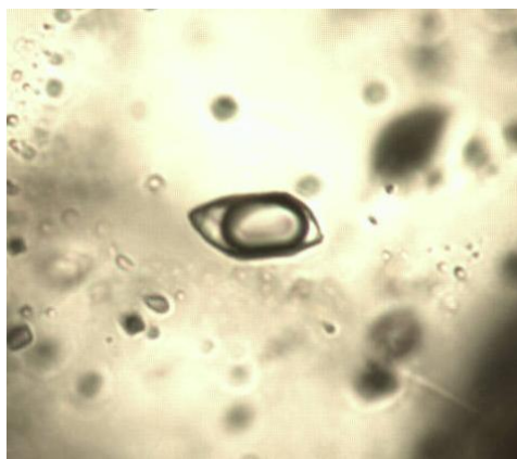
Рис. 1. Двухфазное углекислотное первичное включение (комнатная температура), увеличение x80

Практически все изученные образцы представляют собой смесь белого и серого кварца, что, в целом, характерно для известных золоторудных месторождений Енисейского кряжа. В кварце присутствуют первичные включения и преобладающие вторичные. Первичные включения можно разделить на три типа: 1 – существенно водные двухфазные (вода и водный пар); 2 – двухфазные (при комнатной температуре) углекислотные (при охлаждении отделяется третья фаза – газовая углекислоты) (Рис.1 и 2); 3 – трехфазные гиперсолёные (единичные включения) с кристалликом NaCl. Первичные включения преимущественно располагаются вдоль плоскостей роста в кварце, либо отмечаются как одиночные включения в пределах зерна, правильной формы, с ровными границами.