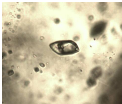
Рис. 2. Двухфазное углекислотное первичное включение (температура -90^{\circ}\text{C} ). Жидкая фаза углекислоты замерзла, увеличение x80.

Температура гомогенизации первичных водных включений составляет от 170 до 210^{\circ}\text{C} , углекислотные и гиперсолёные при температуре выше 240^{\circ}\text{C} вскрываются, возможно, за счет избыточного давления во включениях (от 1,5 до 2,3 кБар). Соленость водных включений составляет 21-22 масс.%, NaCl-экв., углекислотных – от 3-4 масс.%, NaCl-экв., гиперсолёных – >30 масс.%, NaCl-экв.