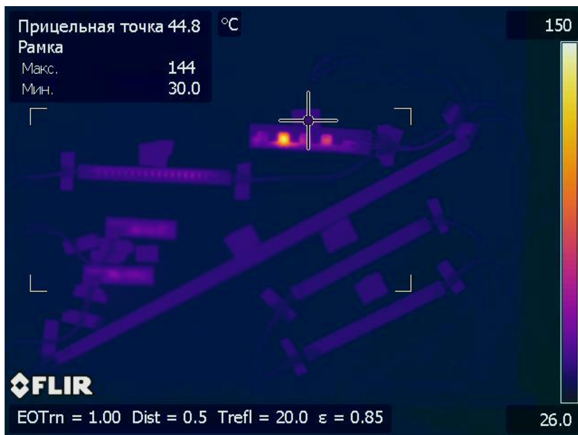
Рисунок 2– Нагреватель при тепловой нагрузке 0,55 Вт/см 2

1) Один из семи исследованных нагревателей 1555 (ser. N 1) имел область размером с один виток, с температурой до 145°C при тепловой нагрузке 0,55 Вт/см 2 и температуре посадочной поверхности 40°C. Снимок нагревателя при тепловой нагрузке 0,55 Вт/см 2 представлен на рисунке 2.