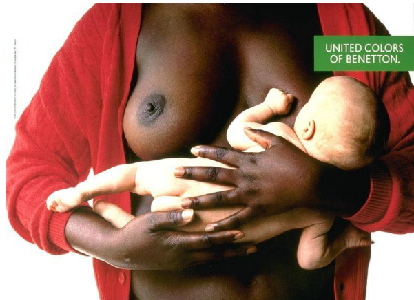
Рисунок 2. Социальная реклама фирмы Benetton [6].

Разобрав вышеназванные примеры, можно сделать вывод, что использование этнокультурных образов в эпатажной рекламе возможно, но при условии, что данный образ выступает не в качестве оскорбления, а, можно сказать, «сотрудничает» с иным стоппером. Так же стоит отметить, что применение исследуемых образов уместно, если социальная реклама эпатажна,