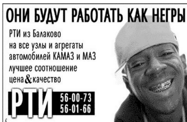
Рисунок 1. Реклама резиново-технических изделий для автотранспорта [7]

Стоит отметить, что эпатаж в рекламе при использовании этнокультурных образов можно рассматривать с двух позиций. Эпатаж может применяться с точки зрения оскорбления, принижения позиции некоего этноса. Например, (рис. 1) рекламное объявление, рассказывающее о резиново-технических деталях для автомобиля заявляет, что эти детали будут «работать как негры».