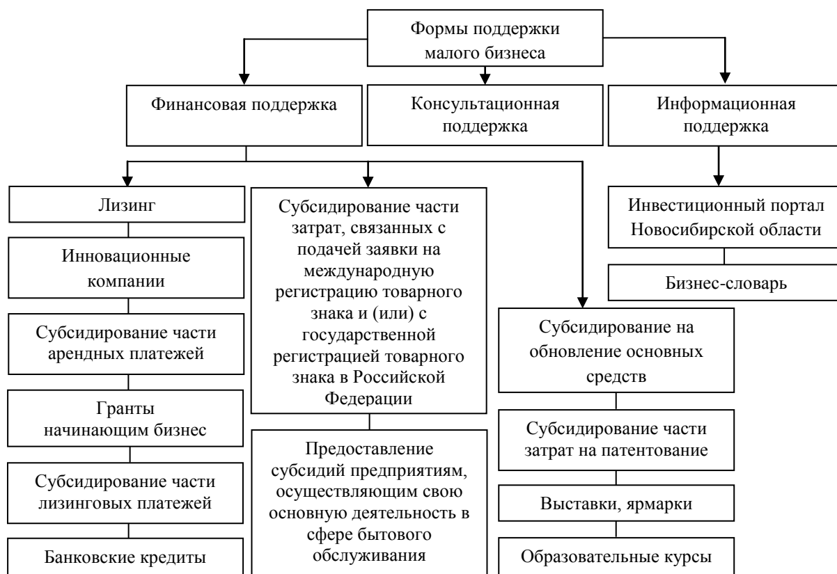
Рисунок 1 - Формы поддержки малого бизнеса в Новосибирской области

Новосибирская область по относительному показателю - количество субъектов малого бизнеса в расчёте на душу населения, занимает одно из лидирующих мест в России, притом в последнее время этот показатель растёт. Так, в период с 1 июля 2010 года по 1 июля 2011 года, он продемонстрировал максимальную динамику - почти 60%.