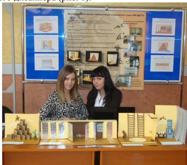
Рис. 1. Авторы проекта

Нами был разработан проект по благоустройству спортзала НИ ИрГТУ направленный на повышение комфортности, улучшения эстетического состояния, с позиций современного молодого дизайнера (рис. 1).