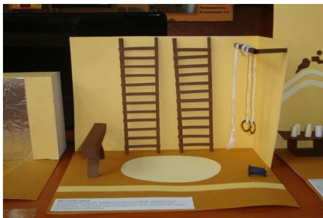
Рис. 5. Спортивный комплекс

3. Спортивный комплекс прекрасно смотрится в интерьере, а также заполняет пустое пространство. Этот комплекс дополняет уже существующую в спортивном зале шведскую стенку (рис. 5).