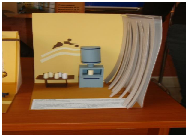
Рис. 6. Жалюзи на окна

4. Жалюзи на окна предназначены для защиты спортивного зала от прямых солнечных лучей, которые очень сильно утомляют студентов, что доказано на личном опыте при посещении занятий физической культуры (рис. 6).