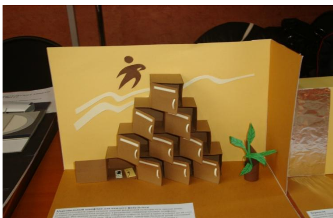
Рис.3. Шкафчики для хранения ценных вещей студентов

1. Шкафчики для мелких, ценных вещей студентов (рис. 3). Шкафчики предназначены для того, чтобы в них хранили свои ценные вещи студенты, так как на данный момент хранятся в пакетах на скамейках спортивного зала, что создает дискомфорт.