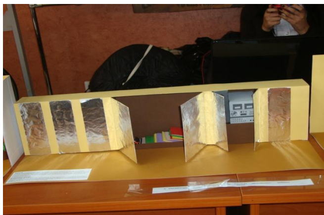
Рис. 4. Зеркальные встроенные шкафы

3. Спортивный комплекс прекрасно смотрится в интерьере, а также заполняет пустое пространство. Этот комплекс дополняет уже существующую в спортивном зале шведскую стенку (рис. 5).