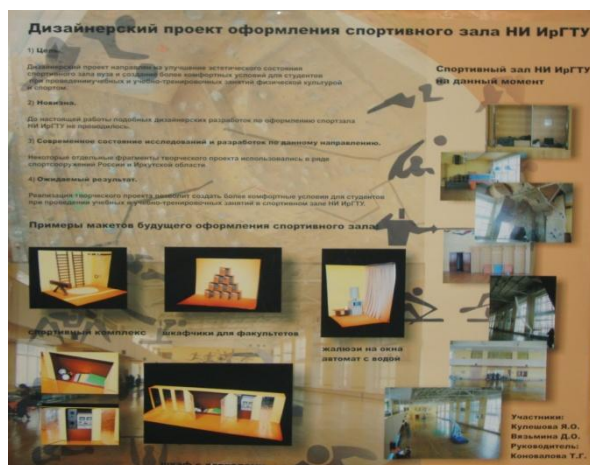
Рис. 2. Макет проекта дизайнерского оформления спортивного зала

Новизна предлагаемой идеи состоит в том, что подобных дизайнерских разработок по оформлению зала НИ ИрГТУ не проводилось. Первоначально нами было проведено обследование спортивного зала, отмечены те, или иные моменты, снижающие комфортность пребывания студентов на занятиях физической культуры.