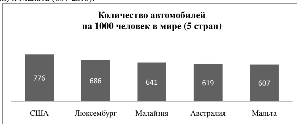
Рисунок 1 – Первая пятерка стран мира по количеству автомобилей на 1000 человек

По данным ООН на январь 2011 года, в первую пятёрку мира по количеству автомобилей на 1000 жителей вошли (рисунок 1): США (776 автомобилей на 1000 жителей), Люксембург (686 авто), Малайзия (641 авто), Австралия (619 авто на 1000 человек) и Мальта (607 авто).