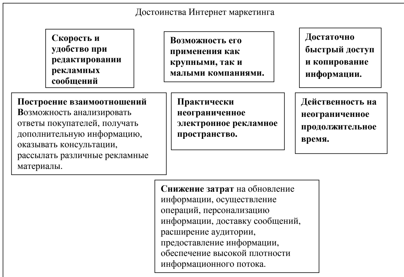
Рисунок 1 – Основные достоинства Интернет маркетинга

Эксперты отмечают, что эффективность рекламы в интернете в несколько раз превышает эффективность рекламы на транспорте, в СМИ, стендовой рекламы и т.п.