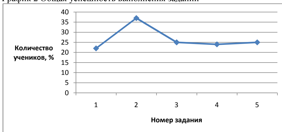
График 2 Общая успешность выполнения заданий

Согласно этим данным, можно заключить, что у учеников, участвующих в исследовании, в большей степени сформировано умение формулировать выводы (задания 2 и 3). Так же у четверти участников было выявлено умение находить аргументы и анализировать содержание текста. В меньшей степени у данных учеников сформировано умение интерпретировать и обобщать информацию.