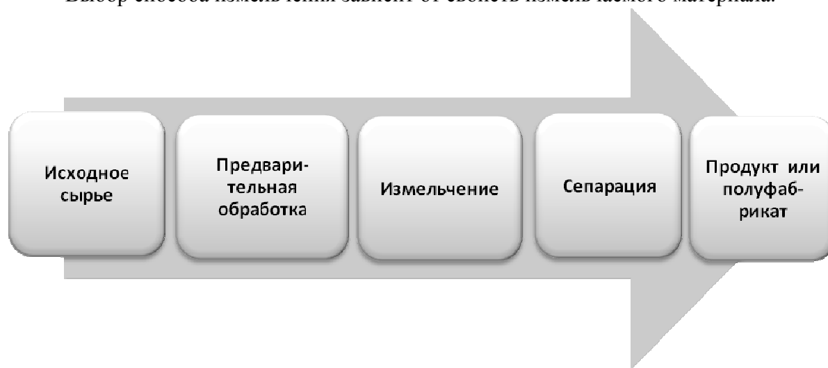
Рисунок 1 – Схема технологической цепи переработки сырья и материалов

Выбор способа измельчения зависит от свойств измельчаемого материала.