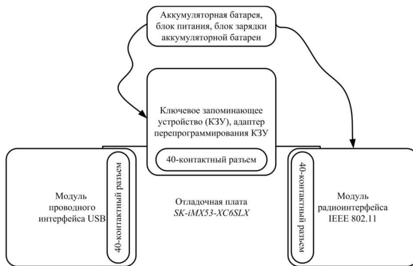
Рис. 2. Структурная схема отладочного комплекса.

Отладочный комплекс (рис. 2) состоит из серийного комплекта разработчика на базе ПЛИС XilinxSpartan-6 в виде отладочной платы и четырех отладочных модулей, представляющих собой ключевые узлы конечного устройства. В состав отладочного комплекса входят модуль проводного интерфейса USB ; модуль радиointерфейса IEEE 802.11 ; модуль, включающий в себя ключевое запоминающее устройство (КЗУ) и адаптер перепрограммирования КЗУ; модуль, включающий в себя аккумуляторную батарею, блок питания, блок зарядки аккумуляторной батареи.