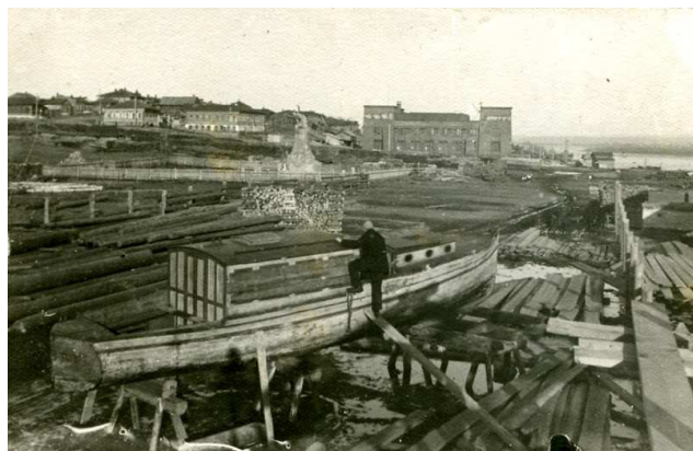
Рисунок 1. Памятник Всевобучу на Лесной площади

Проектирование и строительство архитектурного ансамбля по левую сторону Енисея началось в 1967 году по проекту архитектора А. С. Демирханова. На площади 350-летия Красноярска были построены: городской Дом Советов (ныне Администрация города), гостиница «Красноярск» (1970 год), здание Енисейского речного пароходства, здание Красноярского государственного театра оперы и балета (1966 - 1978 гг.). При проектировании ансамбля были определены основные визуальные оси и доминанты, грамотно формирующие пространство.