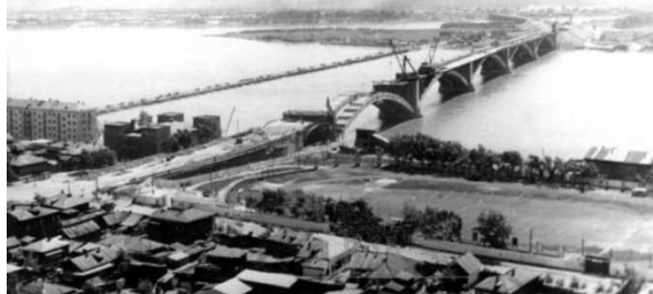
Рисунок 4. Строительство Коммунального моста

В 1995 году на нижнем ярусе площади был установлен памятник А. П. Чехову, как дань уважения и благодарности красноярцев великому русскому писателю и почётному гостю города, который говорил о столице края как о самом лучшем и красивом из всех сибирских городов. Изначально ансамбль был задуман в виде двух частей. Первая часть - собственно памятник, усиленный природным монолитом скалы, вторая - живая панорама неповторимо прекрасного и величественного Енисея. По замыслу авторов - А. С. Демирханова и скульптора Ю. П. Ишханова, памятник и природная панорама должны были стать единым целым. Одновременно с созданием памятника Чехову на выходе к реке планировалась инженерно-архитектурное оформление второй части комплекса - подземный переход под пролежавшей ниже площади автотрассой, соответствующая реконструкция смотровой части набережной.