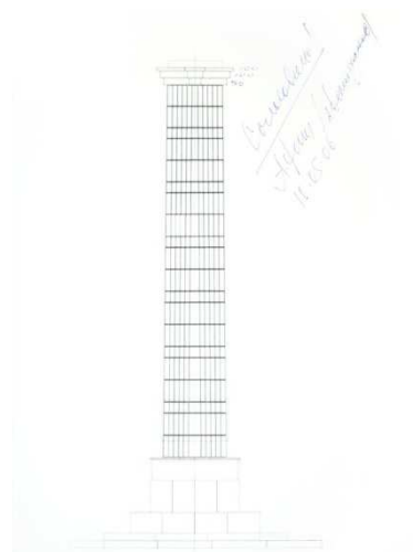
Рисунок 7. Утвержденный вариант оформления колонны

В последнее время реконструкции подверглось здание гостиницы «Красноярск». Полностью был обновлен фасад здания, в большой степени возросло количество коммерческой рекламы, что кардинально изменило облик здания, так органично дополнявшего сложившийся архитектурный ансамбль. В дополнение ко всему часть территории Театральной площади отдана под застройку для еще одного отеля. Это решение вызвало неоднозначные эмоции жителей города, но, можно с уверенностью заявить, оно однозначно повлияет на образ комплекса в целом, на его пространственную и планировочную структуры.