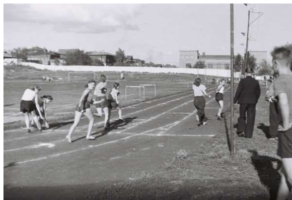
Рисунок 2. Стадион "Динамо"