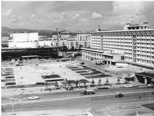
Рисунок 3. Строительство Театра оперы и балета

Третий этап развития территории можно охарактеризовать как этап реконструкции и дополнения. В конце 90-х годов на площади появился небольшой объем, перекрывший любимую горожанами перспективу на Енисей – здание ресторана «Фон-Барон». Еще одним неприятным сюрпризом стало возведение развлекательного центра, не предусмотренного в изначальной концепции организации площади и обернувшимся гигантским металлическим долгостроем.