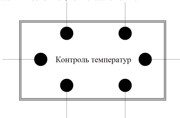
Рис. 1 Контроль температур по сечению печи в зонах подогрева, обжига и охлаждения

Для ведения технологического процесса необходимо сформировать однородные температурные поля по высоте печи и обеспечить их поддержание в необходимом интервале температур. Условно печь обжига известняка можно разделить на три зоны: зона подогрева, зона обжига и зона охлаждения. Для осуществления оперативного контроля за данными зонами необходимо установить термопары в сечениях печи, соответствующих указанным зонам так, как показано на Рис.1.