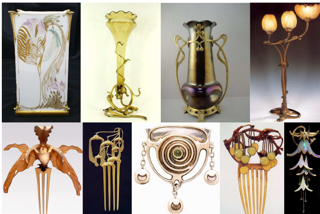
Рисунок 1. Работы мастеров стиля модерн

из переплетающихся вытянутых, ассиметричных образов. Выявив свой язык модерна, отбросив излишества композиции, были найдены новые формы для трёх видов облицовочных панелей, межкомнатной двери и декоративного камина, чьи рафинированные очертания, стремясь к изяществу, не теряют серьёзность и монументальность. Выбор именно такого направления обосновывается обозначением человека, который в данном случае придуман как заказчик. Это безусловно современный человек, но не факт, что его мировоззрение, темп жизни и увлечения находятся в сегодняшнем веке. Его характер, образ жизни, интересы, ценности и моральные устои в своём уникальном виде находят отражение в обстановке его дома, где всё подобно самой природе приглашает к безмятежному созерцанию и покою.