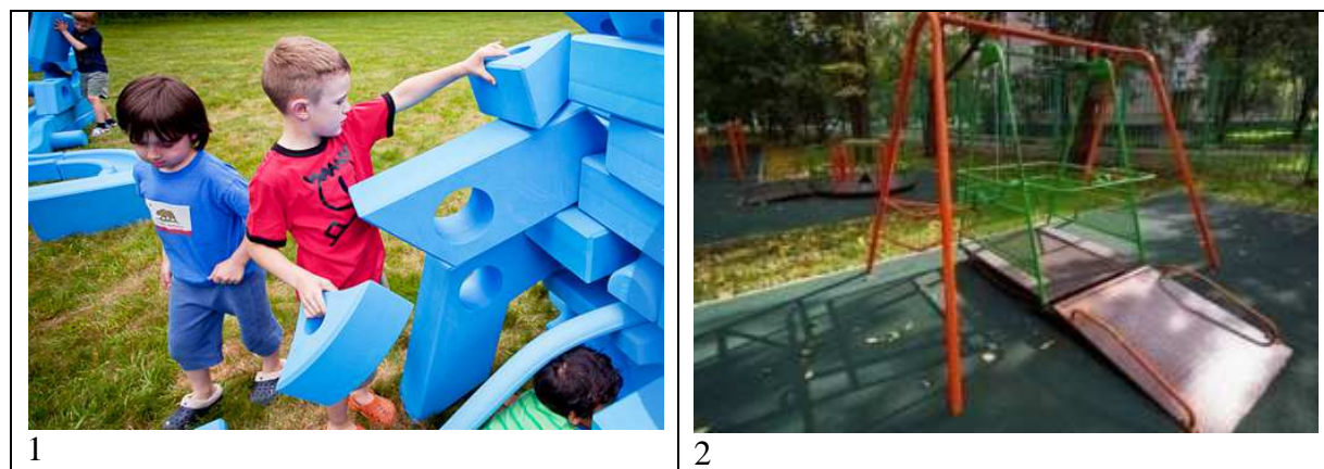
Рис.2. Детские площадки: 1- конструктор «Imagination»; 2 - инклюзивная площадка для детей с ОВЗ.

Значительная часть игровых элементов инклюзивной детской площадки в Сочи спроектирована с учетом особенностей детей с ограниченными возможностями. Так, например, площадка оснащена подъездными рампами для инвалидных колясок, на ней есть многоместные качели, сенсорная стена, специальные экскаваторы и двойная горка. Общая площадь игровой площадки – более 800 кв. м (рис.2.2)