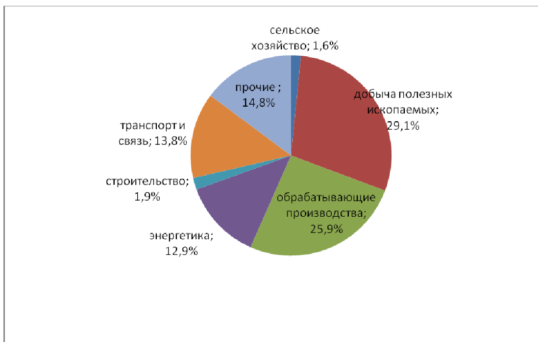
Рисунок 1 – Структура инвестиций в основной капитал.

Большая часть инвестиций в основном капитале приходится на добычу полезных ископаемых и обрабатывающие производства. Доля строительства составляет лишь 1,9 % от всего объема инвестиций (рис. 1).