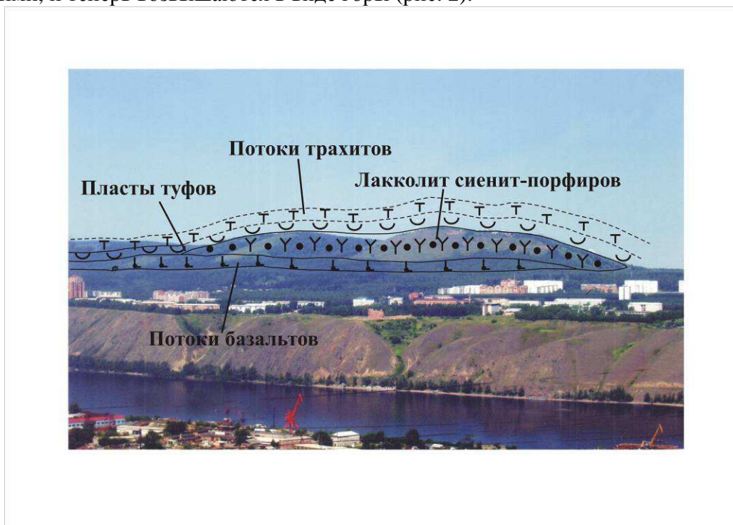
Рис. 2. Лакколит – форма интрузии горы Николаевская сопка.

Но почему вулканические породы есть, а сама гора – не вулкан, хоть и сложена породами магматическими, но глубинными? Сначала здесь в результате вулканических извержений образовалась толща, сложенная лавовыми потоками базальтов и слоями туфов. Возраст этих вулканических пород определён геологами как ордовикский (около 450 млн. лет). Но одна из последних порций магмы не дошла до поверхности, внедрилась между лавовыми потоками, приподняла часть из них над собой и застыла в виде куполовидного тела – лакколита. Когда начались новые поднятия, перекрывающие породы были разрушены, а породы лакколита оказались более прочными, и теперь возвышаются в виде горы (рис. 2).