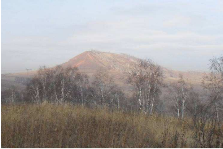
Рис. Вид на Дрокинскую гору с юга. Хорошо видно переслаивание песчаников и известняков.

Таким образом, можно сделать вывод, что вулканические горные породы действительно широко развиты в районе Красноярска, но настоящих гор вулканического происхождения тут нет. Да и не может быть, так как за сотни миллионов лет, прошедшие после прекращения вулканической деятельности, любая гора была бы полностью разрушена. И те горы, которые мы видим сейчас, имеют чисто эрозионное происхождение. Ждать новых вспышек вулканической активности у нас тоже не стоит, так как вблизи от Красноярска нет ни одной из геологических обстановок, в которых могут появиться вулканы – зон столкновения литосферных плит, горячих точек, срединно-океанических хребтов или континентальных рифтов.