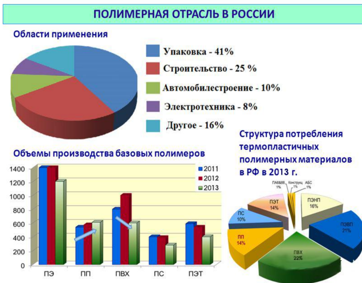
Рисунок 1 – Полимерная отрасль в России

В последнее время во всем мире и у нас в стране широко используются полистирольные материалы. На сегодняшний день невозможно встретить ни один объект, ни одно транспортное средство, где бы они не применялись.