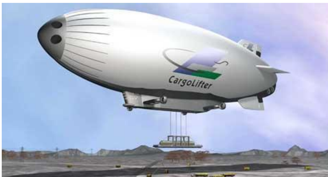
Рис. 2. Проект грузового дирижабля компании “CargoLifter” (Германия – США, 2003 г.)