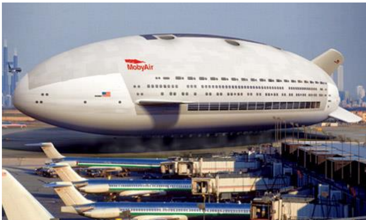
Рис. 3. Строящийся грузовой дирижабль компании “Lockheed Martin Corporation” (США)

Для вертолета эти цифры ощутимо больше – от $ 400 до $ 1000, что объясняется большой расход топлива у вертолетов при низкой массовой отдаче. Кроме того, для использования средств, так сказать, традиционной транспортной авиации (т.е. самолетов и вертолетов) необходимо создание аэродромов, инфраструктурных объектов и решение целого ряда других капиталоемких задач.