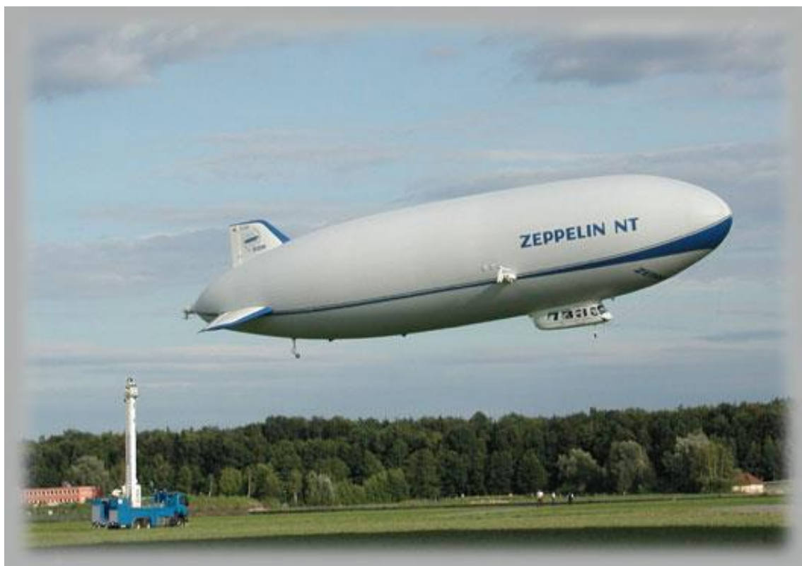
Рис. 1. Действующий в настоящее время дирижабль “Zeppelin NT LZ-N07” производства компании “Zeppelin Luftschifftechnik” (Германия)

суток, тогда как предел вертолета подобного класса составляет только 6 часов. При этом летный час стоит $ 150-200.