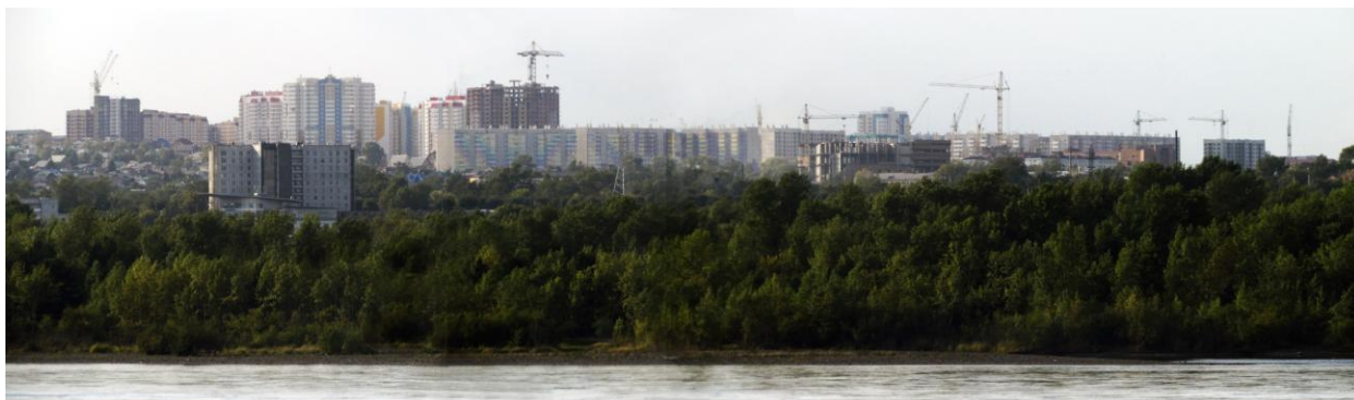
Рис.3 Силуэт г. Красноярска. Вид на левый берег с набережной возле Спасо-Никольского храма.

массе застройки, ее форме, которые в определенной степени оказывают влияние на восприятие каждого элемента городской среды. Характерным недостатком в формировании цельного визуального образа Красноярска является агрессивная и хаотичная застройка города при возрастающей с годами «точности» высотных доминант. (Рис. 3)