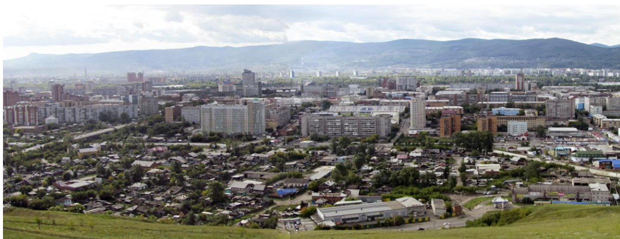
Рис. 2 Вид с Покровской горы.

По мере своего развития город обретает новые пространства с определенным архитектурно-градостроительным силуэтом. Так, например, исторический центр, выделяется на фоне новых жилых массивов, в силуэте города образуются новые контуры, город приобретает новые панорамы (Рис. 2)