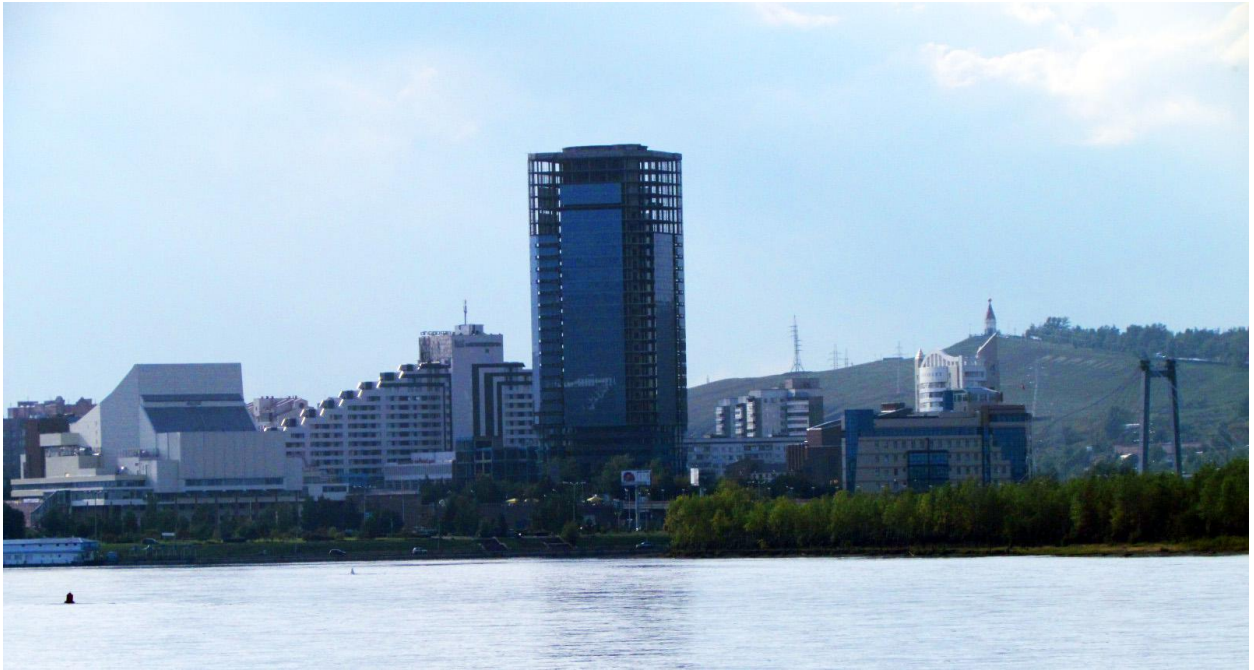
Рис.5 Вид с набережной возле Спасо-Никольского храма на историческую часть города.

В теории градостроительства существует множество приемов и методов построения гармоничного визуального образа города. К. Линч определяет необходимые качества построения цельного образа. Основные из них: чувство цельного, простота форм, непрерывность, пропорциональность, использование доминант, ясность соединения. Дж. Саймондс подчеркивает важность формирования города, как единого целого, выделяя основные качества, такие как: исключение несовместимых элементов, использование ландшафта, введение акцентирующих элементов, введение контраста, исключение монотонности, введение масштаба, построение модуляции вида, логичное завершение перспектив. Саймондс определяет ось, как композиционный «каркас» в построении панорам и силуэтов города.