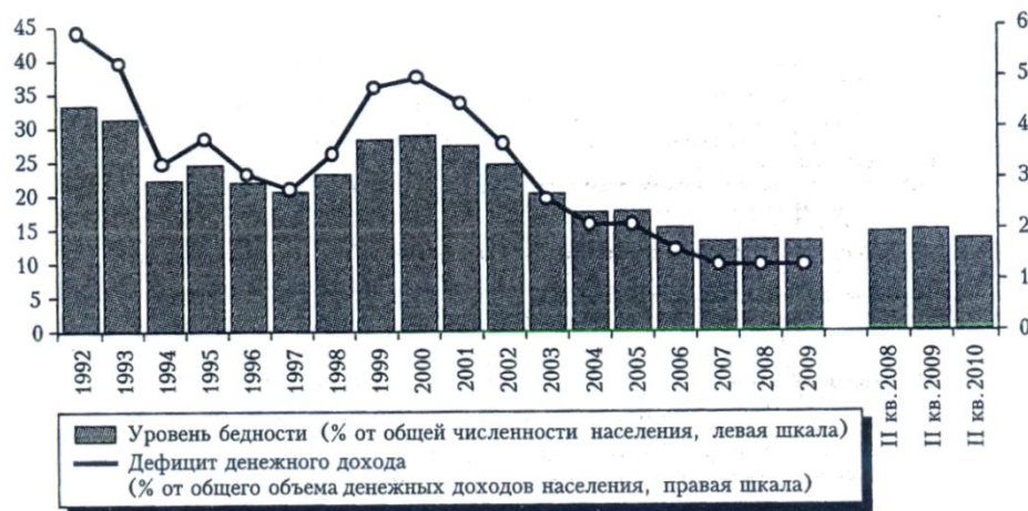
Рисунок 2 – Уровень бедности в России, 1992-2009 гг. (% от общей численности населения)

денежных и натуральных пособий. В зависимости от соответствия доходов прожиточному минимуму нуждающаяся часть населения имеет право на получение социальной помощи.