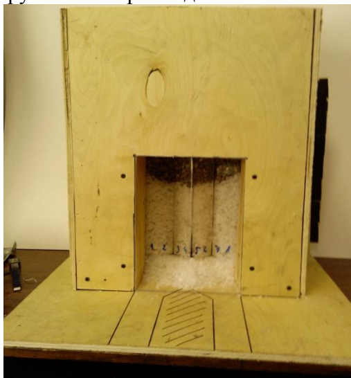
Рис. 1 - Общий вид модели

Была создана модель системы разработки подэтажного обрушения с торцовым выпуском руды с расширяющейся формой забоя, забоем-лавой и линейно-выпуклым фронтом погрузки. Размеры модели ковша соответствуют ПДМ Atlas Copco ST 1520.