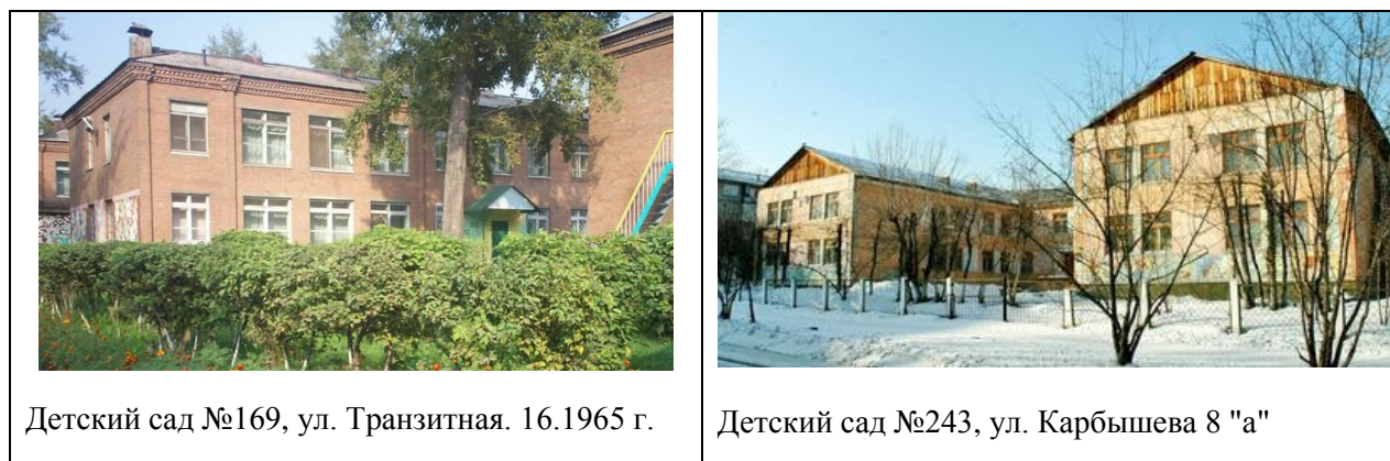
Рис. 1. Детские сады, построенные в Красноярске в 1960 – 1970-х гг.

Массовое строительство панельных зданий детских садов велось в 60 – 70-е годы. Здания отличались единообразием и безликостью. Рассмотрим детские сады, построенные в 1960 -70-е годы в городе Красноярске (рис.1).