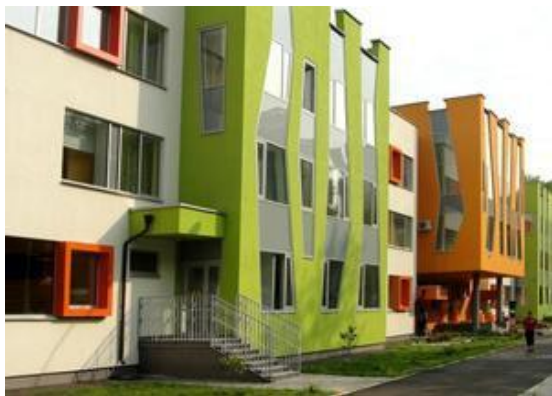
Рис. 5. Детский сад, г. Москва 2-ая Парковая ул, 25

Разработка типовых проектов детских садов, как в Красноярске, так и в Москве, показывают важность цветового решения фасадов. Цвет придает индивидуальность зданиям детских садов, делает их облик более привлекательным.