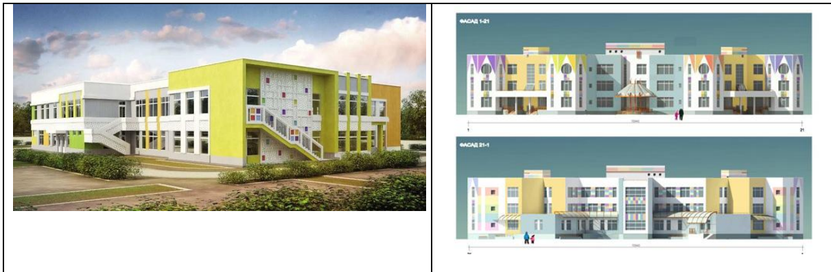
Рис. 4. Типовые проекты детских садов для строительства в Москве

Разработка типовых проектов детских садов, как в Красноярске, так и в Москве, показывают важность цветового решения фасадов. Цвет придает индивидуальность зданиям детских садов, делает их облик более привлекательным.