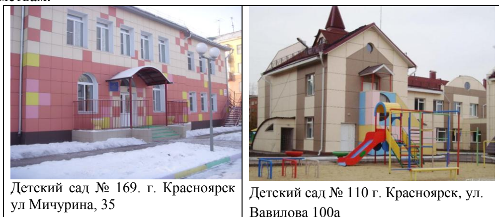
Рис. 2. Фасады детских садов после реконструкции

программы возвращения детских садов, ранее переданных в пользование другим ведомствам.