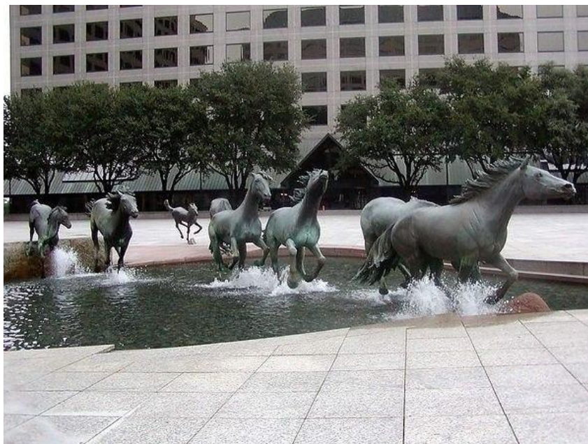
Рис.5 Фонтан “Mustangs at Las Colinas” в Ирвинге, штат Техас. Скульптор Роберт Глен.

Объекты реконструкции принято рассматривать в культурно-историческом контексте Места. Проекты «Духа места» позволяют, в том числе, рассказать о культурной истории данного региона. Например, скульптурное оформление фонтана “Mustangs at Las Colinas” в Ирвинге (США) изображает девять мустангов — диких лошадей, которые в течение долгого времени водились на значительной части территории штата Техас (Рис.5).