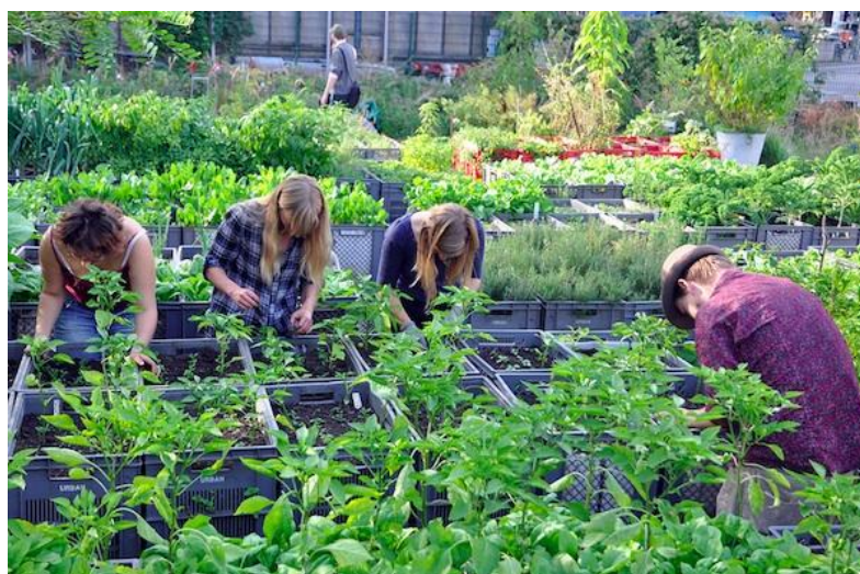
Рис.2 Коллективный сад «Сады принцесс» в г.Берлин. Проект Марко Клаузена и Роберта Шоу.

Целенаправленное изменение качеств открытых жилых городских пространств – роль, которую предписывают коллективным садам Америки. Являясь неотъемлемой открытой частью жилища, они удовлетворяют потребности человека в суточной рекреации, так необходимой в условиях жизни в городе; создается комфортная среда для общения людей, которых объединяет одно общее увлечение – общение с природой (Рис.2).