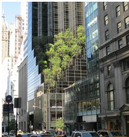
Рис.1. «Живая терраса». Trump Tower, Нью-Йорк. Проект Дера Ската.

и сейчас играют важную роль в социальной жизни общества: сады на крышах (Рис.1), сады в офисах, сады в оформлении жилого пространства, коллективные сады, «карманные» парки.