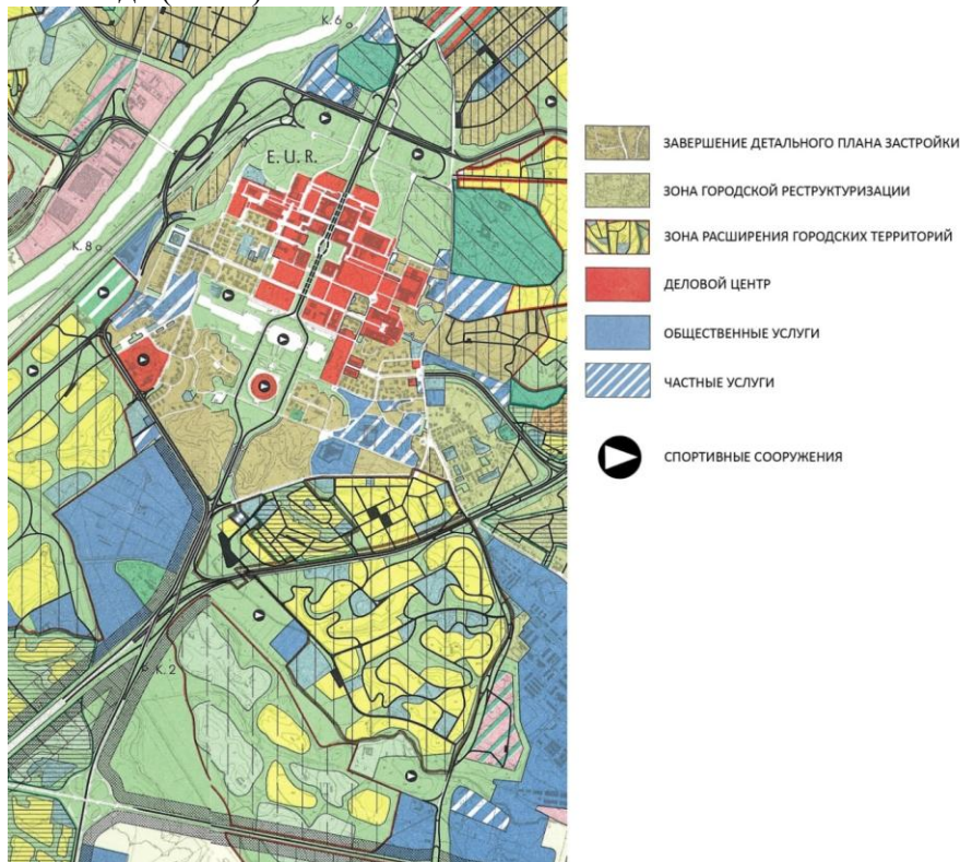
Рис. 2. Фрагмент регулярного генерального плана Рима 1965-1971

некоторые объекты, например искусственное озеро, были построены напротив сооружений, представляющий уже новое время, особенно в свете Олимпийский Игр 1960 года (Рис.2).