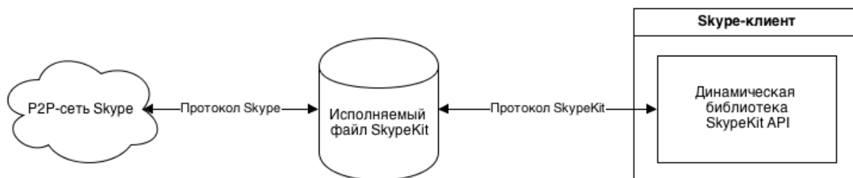
Рисунок 1 – Принцип работы SkypeKit

Доступ к функциям API происходит с помощью наследования от специальных классов, предоставляющих абстракцию над элементами сети (например, Account или Conversation) и вызова их методов. Внешние события, такие как, например, входящий звонок или сообщение обрабатываются с помощью функции обратного вызова (Callback). Для эффективного использования памяти в SkypeKit встроен автоматически сборщик мусора (Garbage Collector).